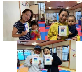
佐賀国体リハーサル大会 9月15～18日 唐津