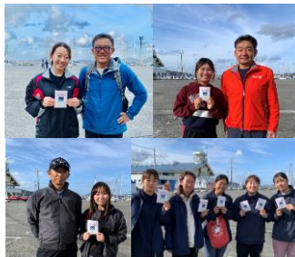
全日本スナイプミックス選手権大会 11月11～12日 小戸