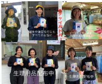
鹿児島国体 10月7～11日 平川