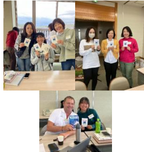
WSレースマネジメントクリニック 11月11日 葉山