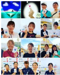
全日本スナイプ選手権大会 8月23～27日 蒲郡