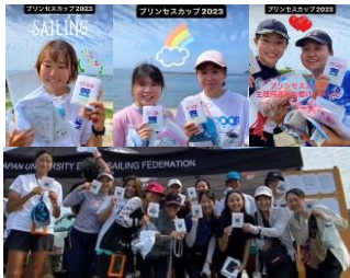
ウィンド学連女子プリンセスカップ 8月28～29日 蒲郡