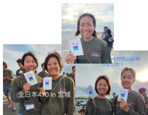
全日本470選手権大会 9月6～10日 宮城