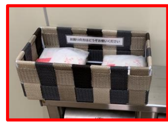
唐津ヨットハーバーには普段から設置あり