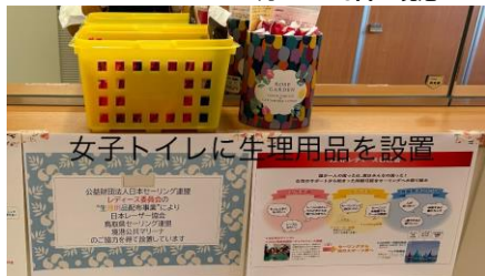
境港公共マリナーのご協力によって女子トイレに設置