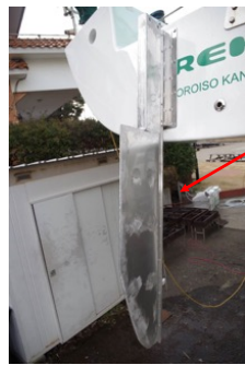
4.15.1 b) ラダー