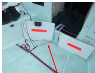
3.08.4 b) せき止め装置