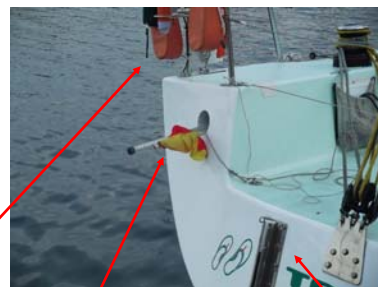
4.15.1 a) 非常用ラダーの スライダー