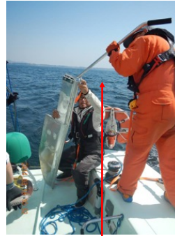
4.15.1 a) 非常用ティラー