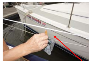
3.14.2 a),b) ライフラインのたわみ