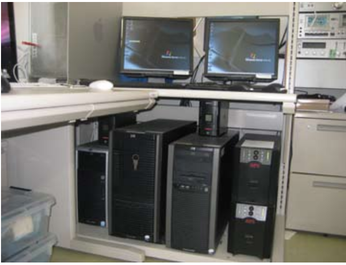
和歌山NTCのパソコンスペースの概要