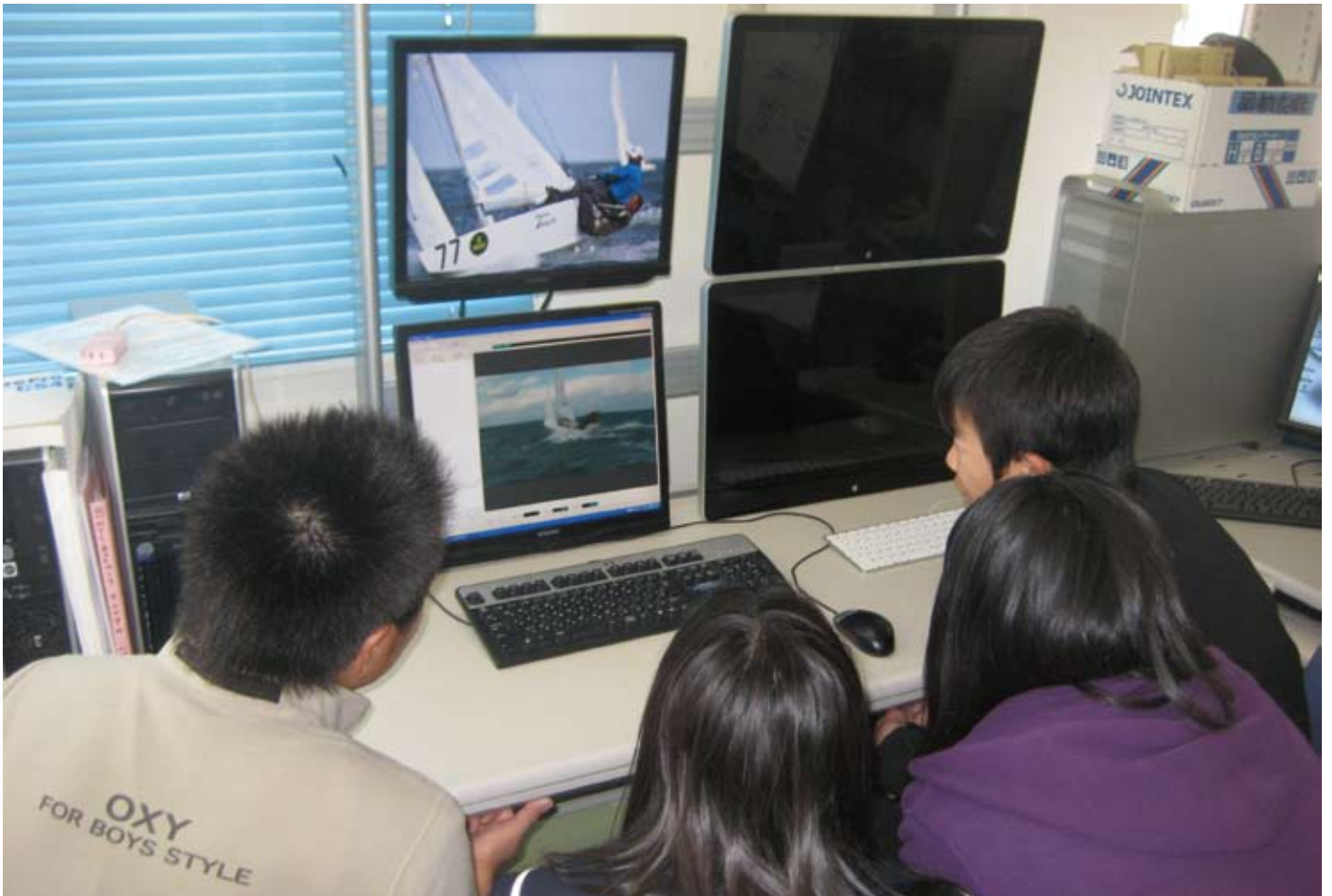
セーリング映像をチェックする和歌山セーリングクラブのメンバーたち